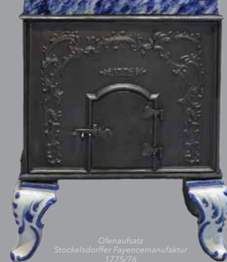
Ofenaufsatz Stockelsdorffer Fayencemanufaktur 1775/76