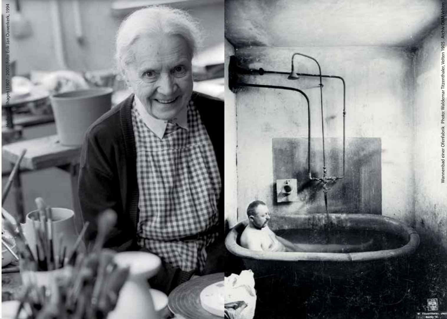
Hedwig Bollhagen (1907 - 2001)