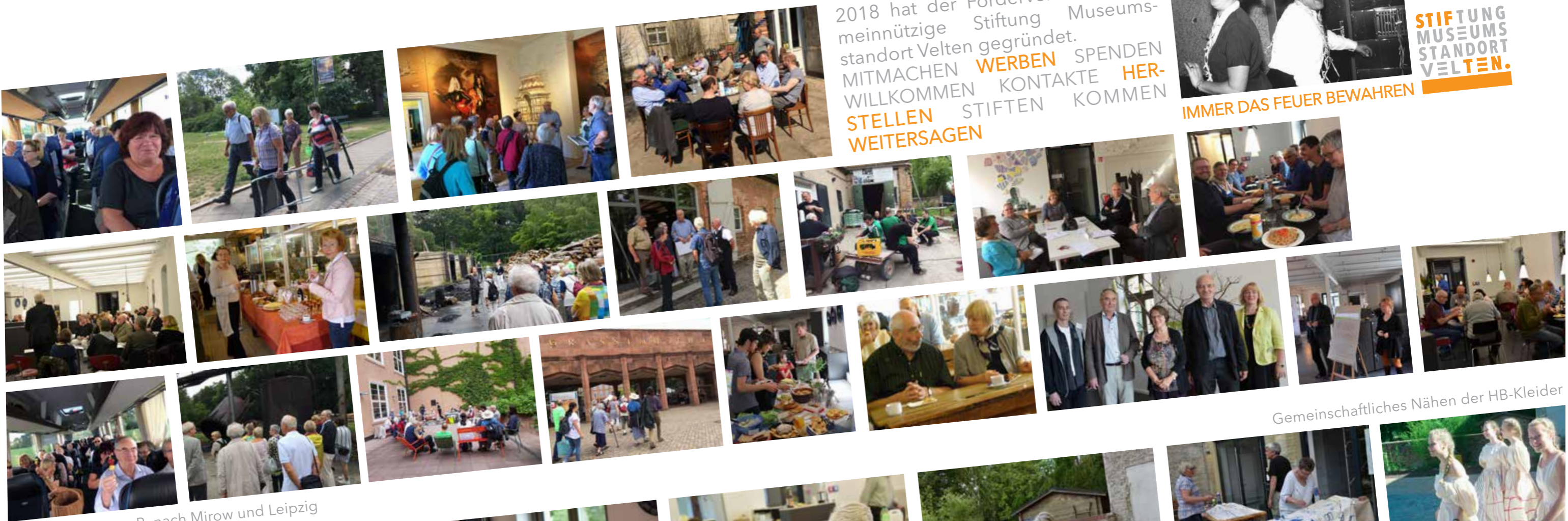
Vereinsausflüge z. B. nach Mirow und Leipzig