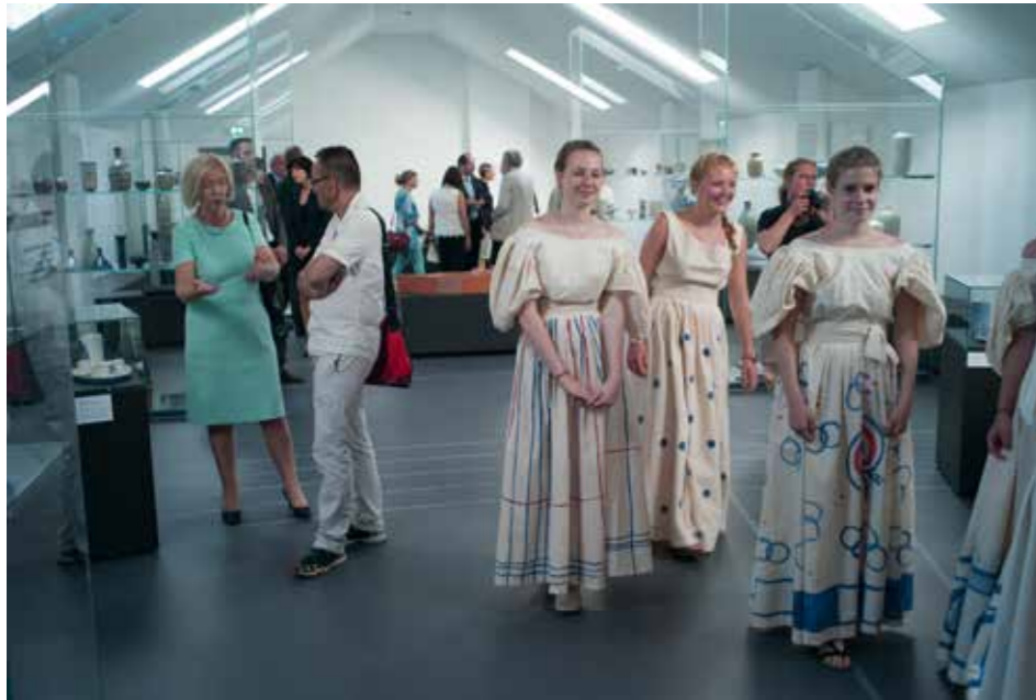
Hedwig Bollhagen Museum